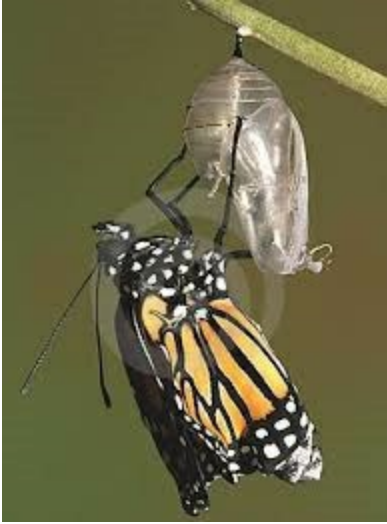
Foto di una farfalla che esce dalla crisalide