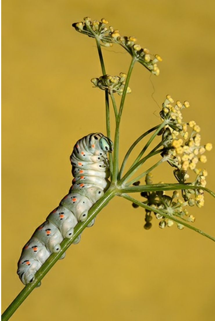
Foto di un bruco