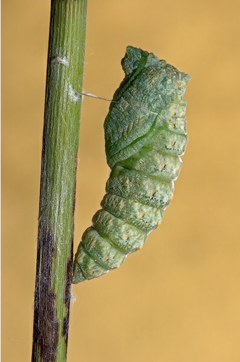
Foto di una crisalide